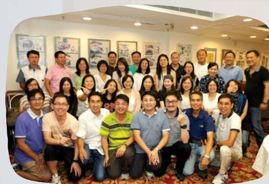
難得一聚，齊齊晚飯

畢業30年，校友希望回母校聚舊，校友會樂於玉成其事。當天有數十名校友參加，有些畢業至今首度重聚，在接待處開始了興奮的「認人手續」；惟恐「年事漸高」，亦有帶同畢業合照核對，輔助記憶。在課室、在禮堂、在操場，大家一一重拾兒時片段，好不溫馨。