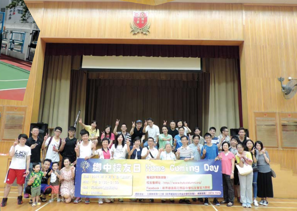
今年來個大合照，明年會否更熱鬧？