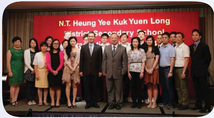
校友會代表與一眾老師留影