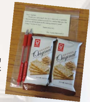
給老師的一點心意