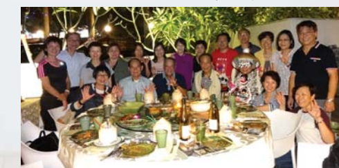
回校下一場，園林再續。