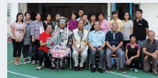
還記得坐著老師的名字嗎？

畢業40年，大家熱切期待的聚會到了。第3屆畢業校友真棒，40年絕對不是短日子，難得的是仍能聯絡上，並成功邀請到五位當年任教的老師一同聚舊！當年的中學生，現在泰半已退休；沒想到40年前的師長，卻風采依然。各位學長，要繼續向各老師多方學習啊！