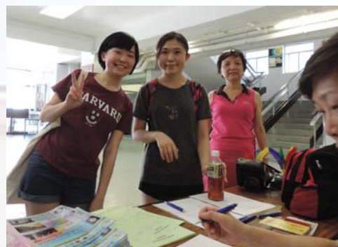
簽名見證你的回歸